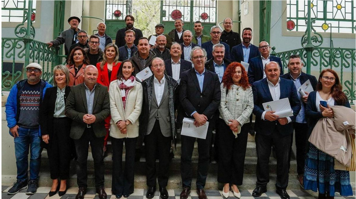
II Encontro Transfronteirizo da Vía Mariana en Melgaço de rexedores galegos e portugueses. // D.P. INDICE

A hospitalidade será a carta de presentación das vilas que conforman a Asociación Vía Mariana Luso Galaica, así o recolle o “Acordo de Melgaço” asinado ante máis de vinte alcaldías de Concellos galegos e presidencias de Cámaras portuguesas, Deputacións, Xunta de Galicia e institucións homólogas de Portugal que participaron no II Encontro Transfronteirizo da Vía Mariana celebrado no concello portugués de Melgaço para avanzar na potenciación do coñecido como “camiño feminino”.