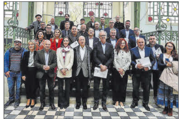
Participantes en el segundo Encuentro Transfronterizo de la Vía Mariana celebrado ayer en Melgaço. #D.P.

"Con tan solo ampliar las zonas, y seleccionando el punto que queremos, accedemos a la información de esa etapa, información de puntos destacados e información sobre