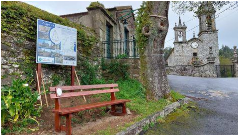
La Vía Mariana a su paso por Moraña CONCELLO DE MORAÑA

«Desde hace cientos de años, las comunidades del rural mantienen la tradición peregrina que cada año los conduce a los santuarios marianos , réplicas cristianizadas de los antiguos cultos del Neolítico o de la Edad del Hierro . La devoción mariana es en este territorio muy anterior a la Xacobeá, pertenece al patrimonio inmaterial de Galicia y permanece llena de vitalidad a lo largo de los siglos», sostienen sus promotores.